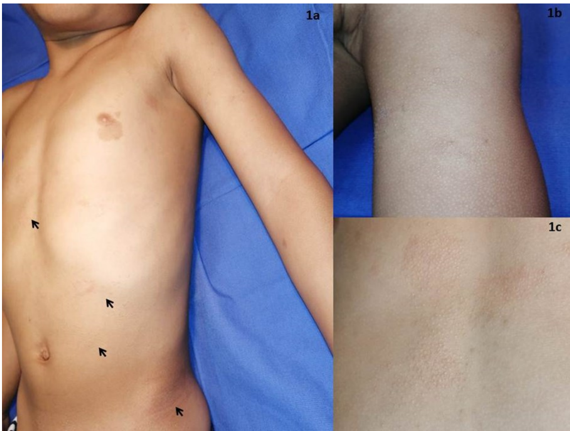
Figura 1. a) Fotografía panorámica que resalta afección de varios segmentos (ver flechas). b) Acercamiento de lesiones en cara anterior de brazo y antebrazo. c) Pápulas brillantes en cabeza de alfiler, color de la piel en cara posterior del tórax.