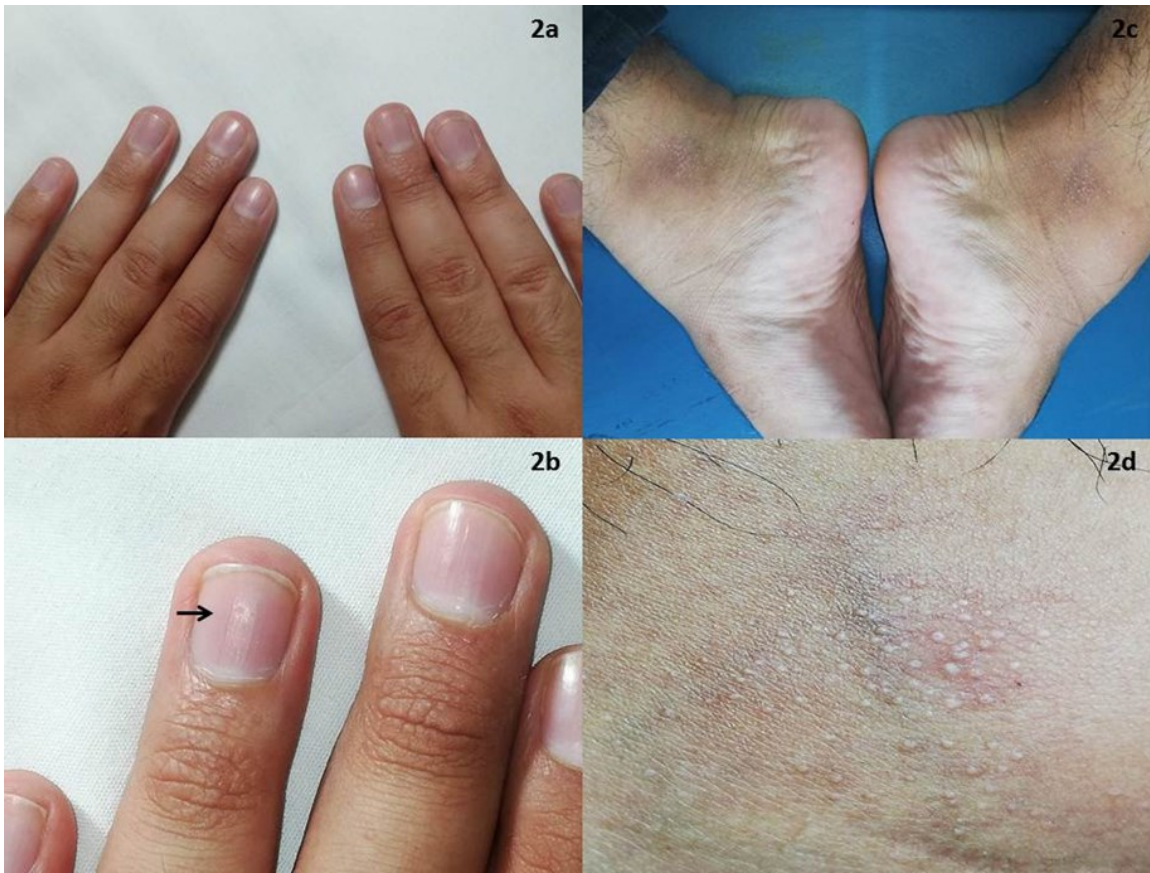
Figura 3. a) Pápulas milimétricas brillantes en dorso de falanges distales. Nótese la simetría y bilateralidad. b) Acercamiento destacando las alteraciones a nivel del aparato ungueal (pits y estrías longitudinales señaladas por las flechas). c) Pápulas agrupadas en cara interna de maléolos. Afección acral simétrica. d) Véase el detalle de las pápulas brillantes puntiformes.